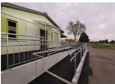
Stade de la Mittelharth